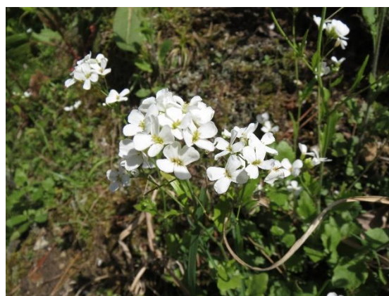
●ハクサンハタザオ