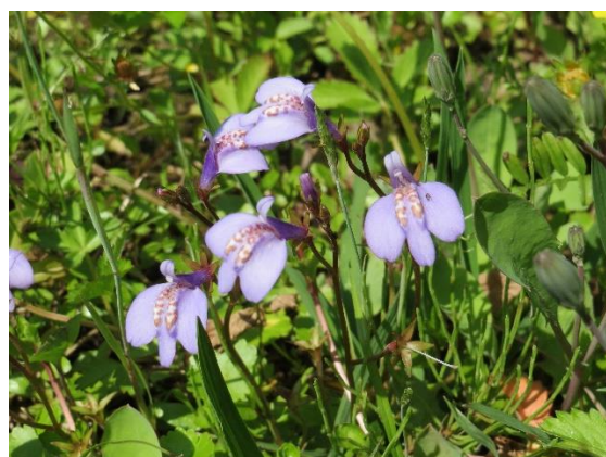
●ムラサキサギゴケ