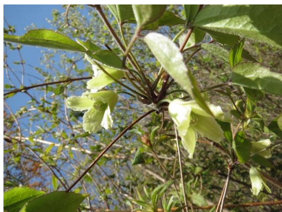
●トリガタハンショウヅル