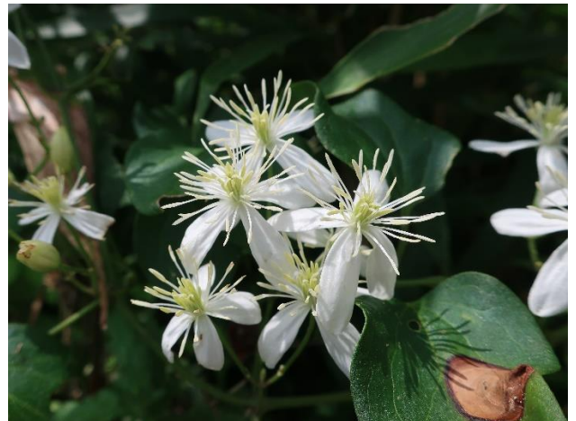
● センニンソウ (クレマチスの原種)