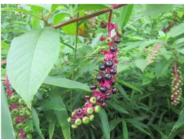
● ヨウシュヤマゴボウ