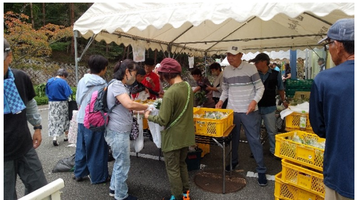
目新しい商品の説明に苦労してます