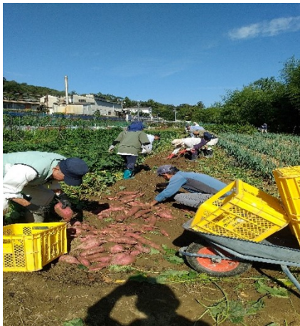
秋晴れの中サツマイモの収穫

今回は目新しい商品「赤ウリ（沖縄キュウリ）」「粘り芋」「ローゼル」「つるむらさき」「しその実」等を陳列し、今後我々の活動の目玉になればと普及に努めました。