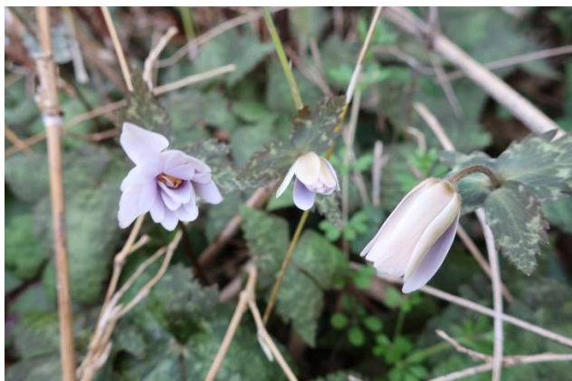
●開きだしたユキワリイチゲ